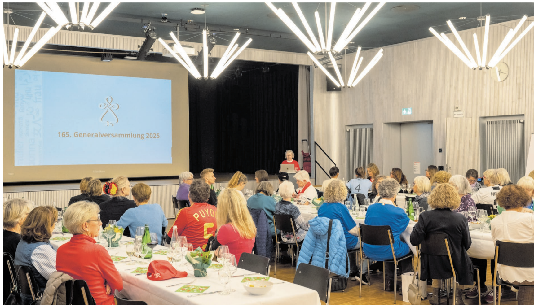
Die Versammlung fand in der Aula der Schule Feldmeilen statt.

Finanziell bewegt sich der Frauenverein Feldmeilen im gewohnten Rahmen. Die Jahresrechnung verzeichnet ein Defizit von rund 3000 Franken, was vor allem auf wohlthätige Vergabungen zurückzuführen ist. Das Bud-